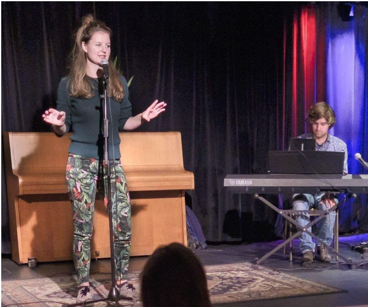
Theater Sita en de Hamburgeroorlog. Spel Lara Sibbing. Muziek Bas van Splunter Regie Daan Overeem